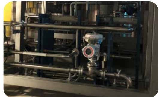
2 in Valvula FlowTop instalada en una Cerveceria

Comuníquese con Flowserve para obtener más detalles y opciones de entrega adicionales relacionadas con el programa Quick-Ship.